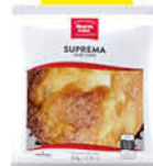
Montes Lara Magdalena Suprema 60 g.