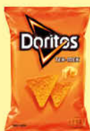
Doritos Tex-Mex 44 g.