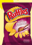
Ruffles Patates xips Pernil 45 g.