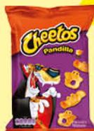
Cheetos pandilla 31 g.