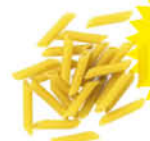
Pasta Pavo Macarrons 5 kg.