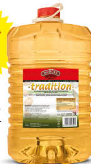
Borges Oli Gira-Sol Tradition 7.5 L