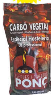
Ponç Carbó Vegetal Premium 15 kg. 19.35€/un.