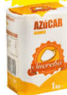
Sucrebó Sucre Blanquilla 1 kg. C10