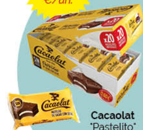
Cacaolat "Pastellito" C15 x pack10

Per la compra de 2 caixes combinades 1 ampolla Lambrusco Dell'Emilia BM Blanc de Regal