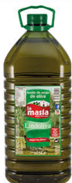
Tavola Oli Oliva Gust Intens / Suau 5 L.