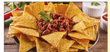
Naxos Tex Mex