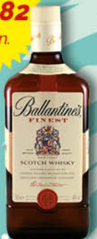
Whisky Ballantine's 70 cl.