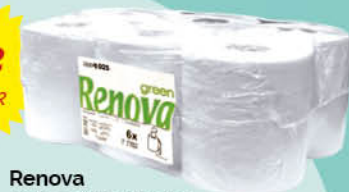
Renova Rotlle eixugamans 130M 2C C-6