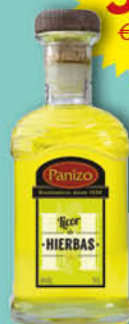
Panizo Orujo Herbes 70 cl.